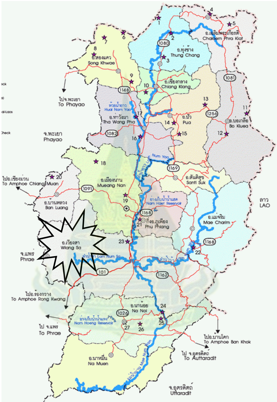
ภาพที่ 2.2 พื้นที่กรณีศึกษา